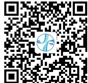
金凤实验室实验动物笼位预约申请表

http://www.jinfenglab.com/tzgg/news/2022-11/26_89.shtml